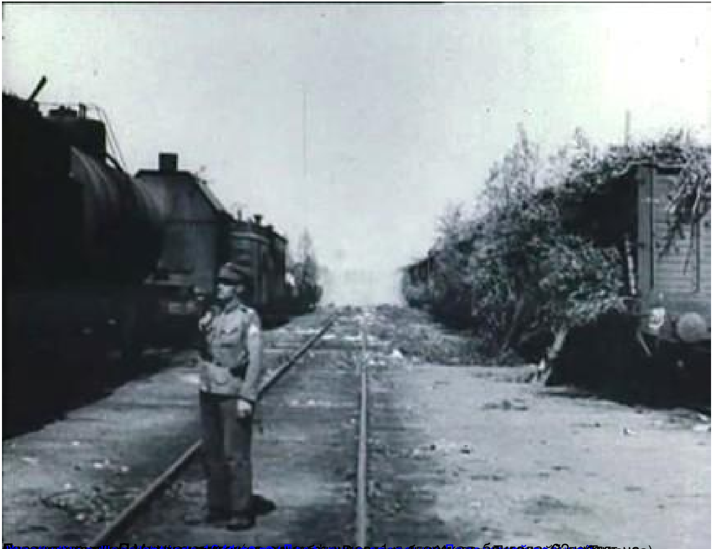
Порталът на Илханоглу е в района на Вилхелм-штрассе в Берлин (дясно), а вляво е републиката (Литона),