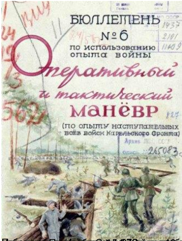
Бюллетень по использованию опыта войны. Оперативный и тактический манёвр. Карельский фронт. 1937 г. Архив Ц.С.С.Р. опис. 265083.

23.06.15 12:32 - Последнее обновление 23.06.15 14:19