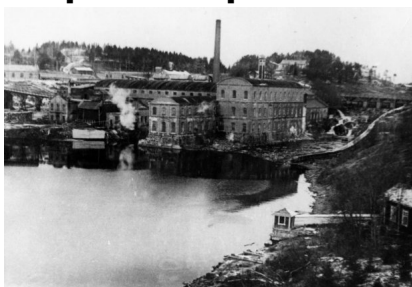
Бумажная фабрика в Ляскеля пос. Ляскеля, 1940 г.

Три раза в сутки бывает шумно на центральной улице Ляскеля — когда меняются смены на бумажной фабрике. Размеренно, неторопливой походкой прошагает трудовой люд, чтобы сменить своих товарищей у станков и машин, а затем поселок бумажников опять погружается в тишину до следующей пересменки, И только сама фабрика, окутанная огромным облаком пара, натуженно гудит в своем рабочем ритме. Здесь жизнь не прекращается ни на минуту. Белый водопад бумаги беспрестанно сбегает с бумагоделательных машин, и кажется, что и машины, и люди все подчинено этому своеобразному падению белизны.