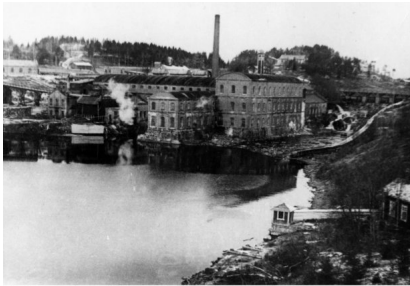
Бумажная фабрика в Ляскеля пос. Ляскеля, 1940 г.

Три раза в сутки бывает шумно на центральной улице Ляскеля — когда меняются смены на бумажной фабрике. Размеренно, неторопливой походкой прошагает трудовой люд, чтобы сменить своих товарищей у станков и машин, а затем поселок бумажников опять погружается в тишину до следующей пересменки, И только сама фабрика, окутанная огромным облаком пара, натуженно гудит в своем рабочем ритме. Здесь жизнь не прекращается ни на минуту. Белый водопад бумаги беспрестанно сбегает с бумагоделательных машин, и кажется, что и машины, и люди все подчинено этому своеобразному падению белизны.