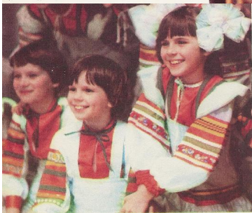
Юные артисты ансамбля «Улыбка»