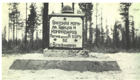
Venälaisten joukkohauta Lemetin tienhaarasta pohjoiseen.

Сколько их было, как выглядели и где располагались БРАТСКИЕ МОГИЛЫ, многих из которых сейчас нет в результате многочисленных перезахоронений?