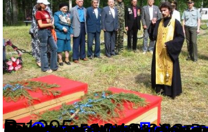
В 1995 году в деревне Лавозоро были обнаружены останки солдат 57-го гвардейского Смертельного Котросса. В 2010 году