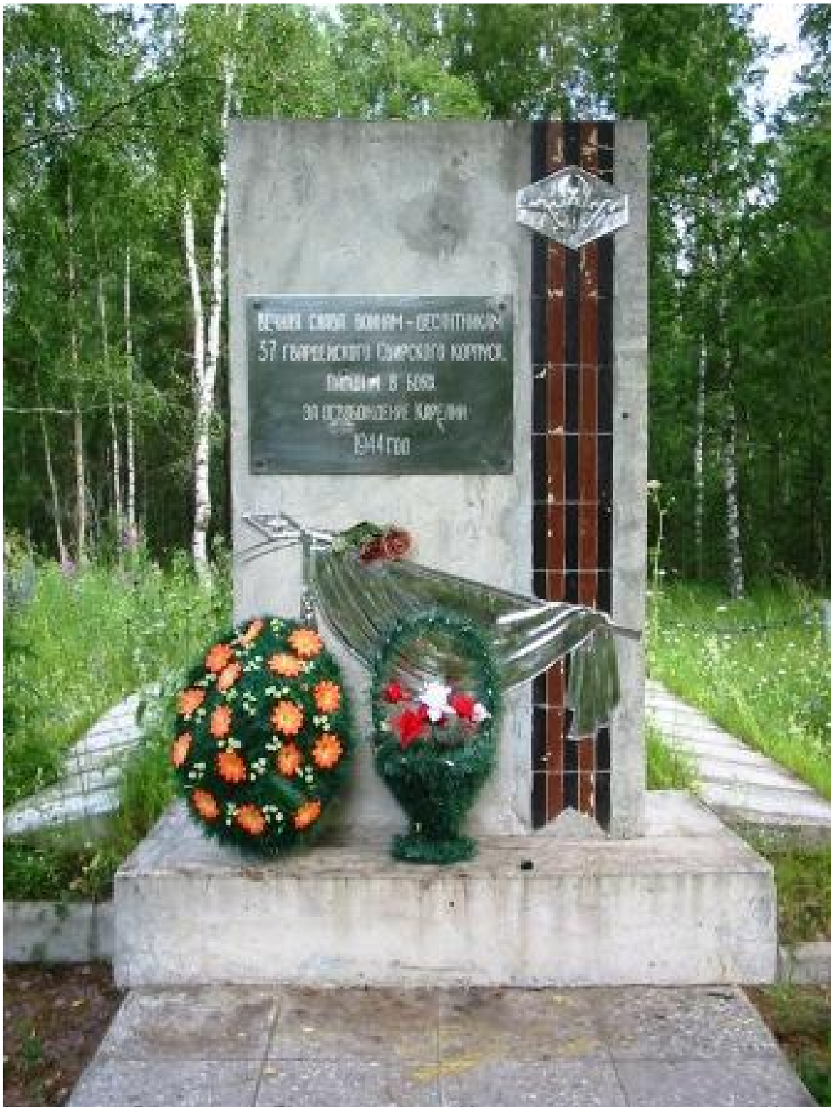
Мемориал в деревне Лавозоро даже в он других мест останки: от Ние-ярви,