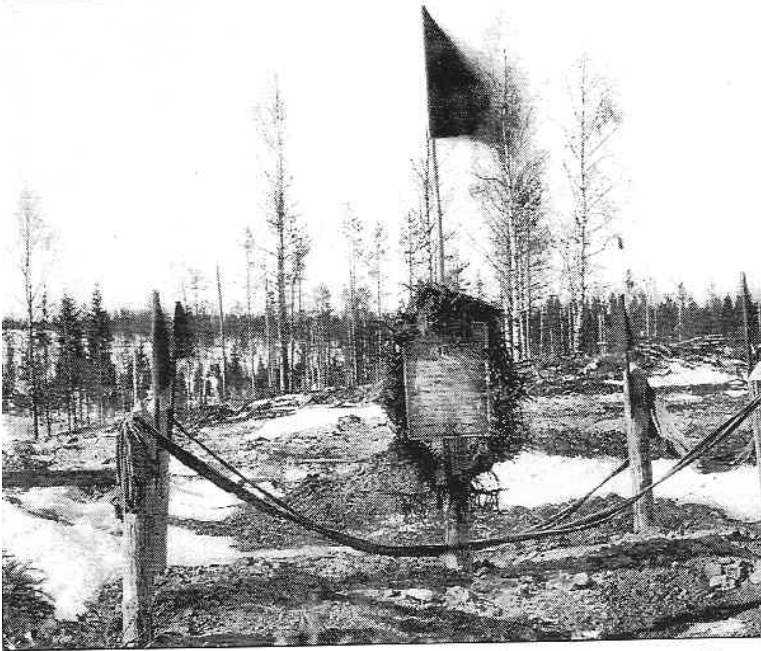
Братская могила командиров дивизии. Южное Леметти. Март

17.12.10 16:27 - Последнее обновление 19.08.14 08:00