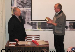
Общественный перит кружку из гильзы с надписью.