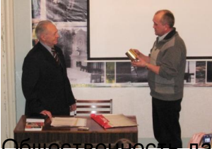
Общественность берет кружку из гильзы с надписью.